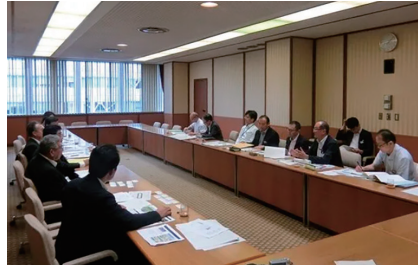
愛知県事業に関する意見交換

自由民主党蒲郡市支部・自由民主党蒲郡市議団で愛知県議会を訪れ、愛知県事業に関する勉強会を行いました。愛知県の道路建設・河川改修・港湾開発に関して、東三河・蒲郡市で進められている事業について、各課の課長さんから説明をいただきました。その後、蒲郡市を中心として個別具体的な質疑応答や要望をさせていただきました。