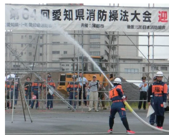
第7分団 操法の様子①