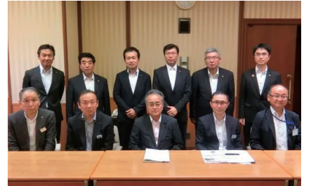
愛知県 各課課長さんと共に