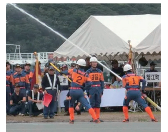
第7分団 操法の様子②