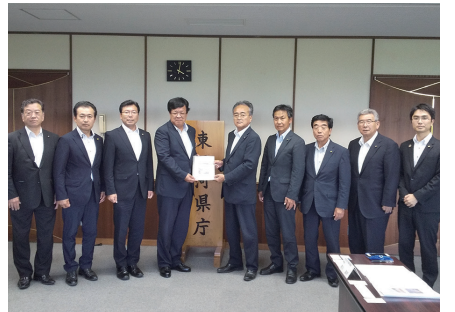
加藤副知事への要望